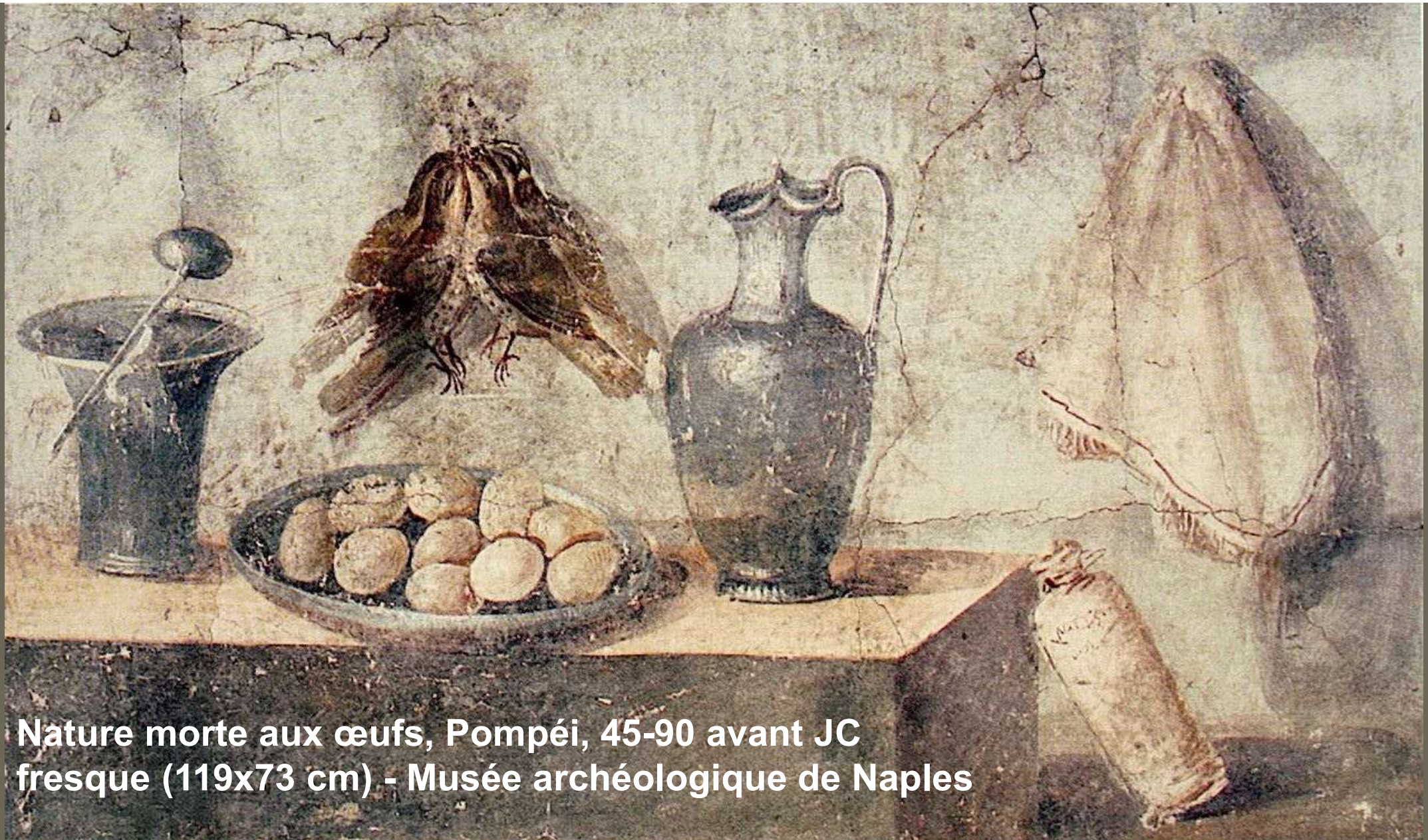
Nature morte aux œufs, Pompéi, 45-90 avant JC fresque (119x73 cm) - Musée archéologique de Naples